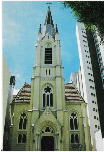
Igreja Martin Luther

Se o observador se situar na Avenida Rio Branco no sentido centro, em frente a localização da Igreja Martin Luther – IECLB. Pode-se verificar que esta foi implantada no lote à aproximadamente 2 metros acima do nível da do passeio, essa implantação, nesse caso construída, situa o edifício em um lugar de destaque. Um plano de base elevado acima do plano do solo estabelece uma separação visual entre seu campo e aquele do solo circundante. A elevação da base cria um domínio específico dentro de um contexto espacial mais amplo, estabelecendo um pódio ou uma plataforma que apóiam estrutural e visualmente a forma e a massa de um edifício. Ching registra em alusão as elevações, que “[...] essas técnicas têm sido utilizadas para enaltecer edifícios sagrados e honoríficos” (CHING, 2002:105)