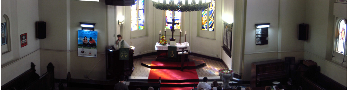
1.1.2. Vista Panorâmica do altar da Martin Luther

esquerda um arranjo de flores e a direita os elementos da ceia 15 , o pão e os cálices de vinho, cobertos por um pano branco. Aproximadamente um metro à frente da mesa há um púlpito, como aquelas estantes usadas por maestros para colocar partituras, que é utilizada para apoio do boletim 16 e do hinário 17 .