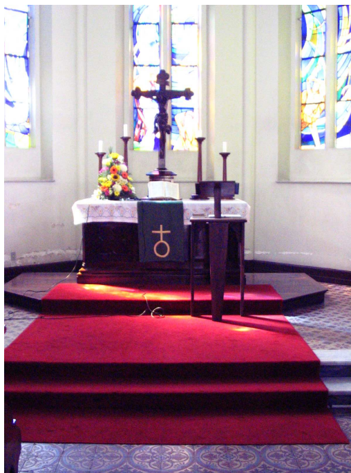
1.1.1. Martin Luther

A ordem referente ao altar da Martin Luther, vê-se uma mesa, de madeira, que fica ao fundo, mas um pouco distante da parede. Esta mesa fica recoberta por uma toalha branca, bordada a mão, e bem ao centro um tecido de outra cor – que no dia em que foi tirada essa foto era verde. Sobre este tecido cuja cor muda conforme os períodos do ano litúrgico, vê-se um crucifixo, de madeira escura, com a imagem de Jesus Cristo pregado nele, com a cora de espinhos e um tecido sobre a região pélvica. Na frente do crucifixo há uma Bíblia aberta, também sobre o tecido colorido. Na mesma direção do crucifixo há quatro castiçais também em madeira com velas acesas, sendo que ficam dois à direita e dois à esquerda. Este crucifixo e os castiçais são os mesmos que vieram da Alemanha quando da construção da Igreja. Sobre o altar ainda vemos à