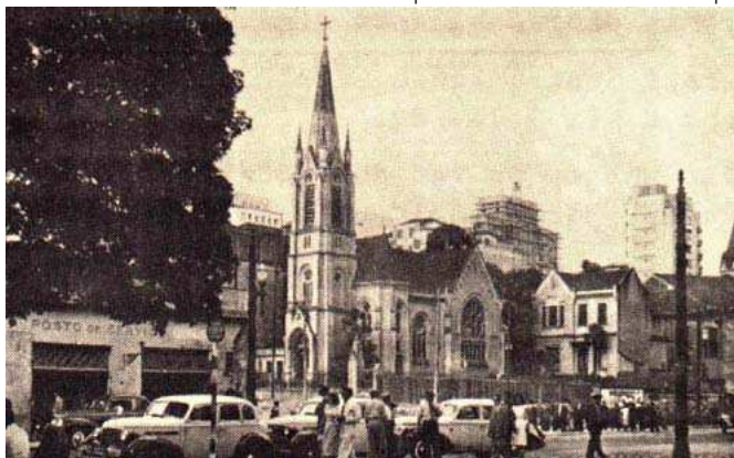
Igreja na década de 50